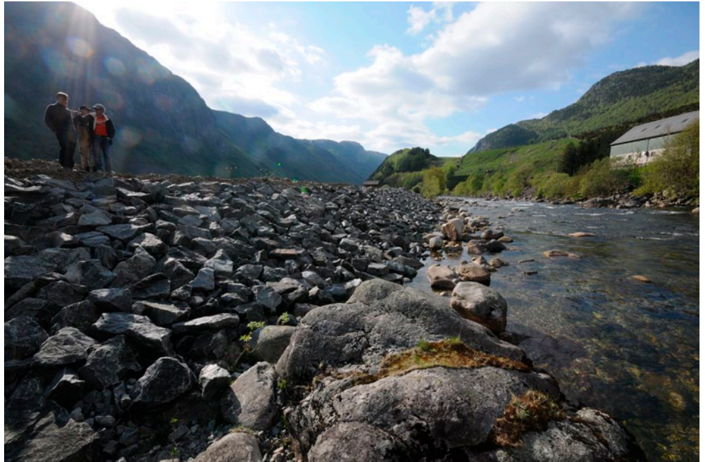
Over en strekning på ca 100 meter består elvebredden av en stor fylling med sprengstein. Steinen går ut i elva og det meste av fyllingen ligger i flomsone.