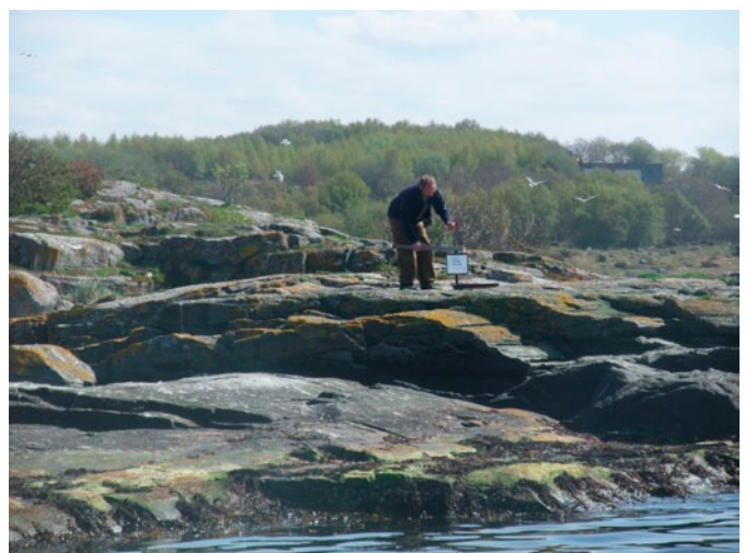
6 hekkeholmer i Stavanger er nå skiltet med ilandstigningsforbud.

Fire av de seks holmene som nå er vernet har store hekkebestander. Det gjelder særlig Skeieholmen og Svartaskjer, men også Majoren og Tjuholmen. Plenting har ingen hekkende sjøfugl, mens bestandene på Ormøyholmen har gått markert tilbake de siste årene. Fis-