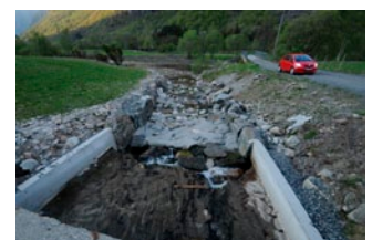
Frøylandsbekken er ødelagt som gytebekk etter gravearbeider.

Naturvernforbundet ber NVE nå vurdere om Gjesdal kommune har brutt bestemmelser i vannressursloven.