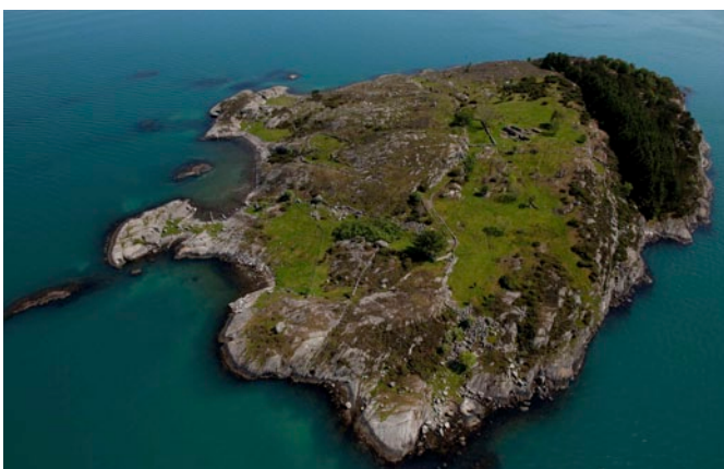
Store Marøy – et spennende natur- og kulturlandskap.