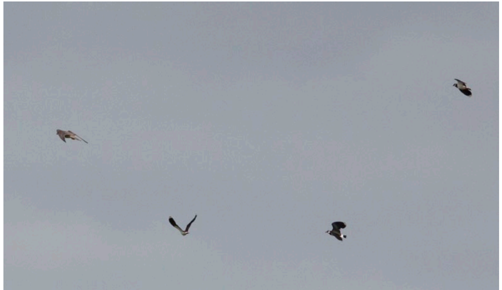
Vandrefalk med en hale av illsinte vipper.

med vipper etter seg, og falken som landet blir ikke sittende lenge, et stupangrep fra ei hissig vipe-mamma er sikkert greit, men en jevn strøm av direkte anslag blir for mye. Kaoset er over like fort som det startet, falkene forsvinner og vipene finner etter hvert roen igjen. Det gikk bra denne gangen.