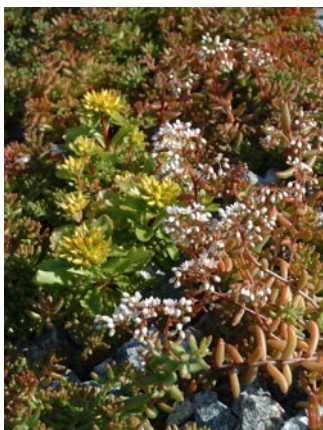
Sedumplantene blomstrer i flere farger, både rødt, hvitt og gult.

– Opp mot 50 prosent av regnvannet som faller på sedumtak, fordampes gjennom planten. Resten av vannet drenerer sakte ut gjennom sedumdekket, som virker som en svamp. Til tross for det, blir ikke taket så tungt at det er nødvendig med forsterket tak-