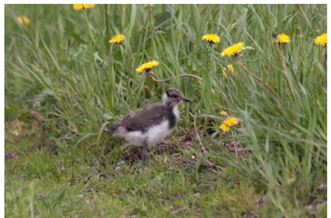
Vipeungene har best sjanse til å overleve der vipene hekker i koloni.

Jæren. Bestandstall er etterspurt av forvaltningen, og kan også ha betydning når vipas rødlistekategori skal vurderes på nytt om noen år.