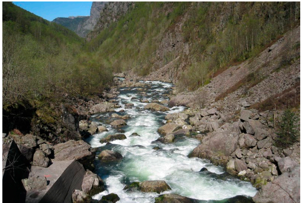
Laksens gyting og vandring i Giljajuvet vil bli hindret dersom elva reguleres.

-Kraftutbygging i Giljajuvet vil ødelegge laksestammen i Dirdalselva, frykter fylkeslederen i Norges Jeger- og fiskerforbund Oddvar Vermedal. Det samme mener Naturvernforbundet, Fylkesmannen i Rogaland og fylkesutvalget i fylkeskommunen som alle frarår utbyggingsøknaden fra Fjellkraft AS. Også Gjesdal kom-