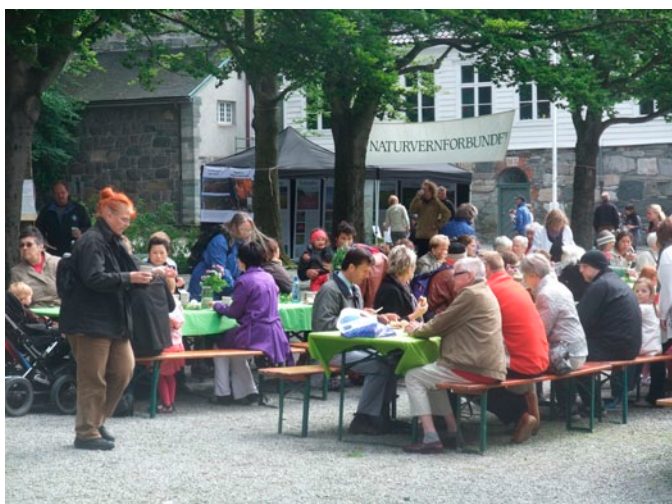
Naturvernforbundets utstilling viste godt igjen i skolegården på Kongsgård lørdag 4. juni.

Spørreundersøkelsen vi har laget til utstillingen ble besvart av over 50 personer. 5 deltakere klarte full pott, det vil si 20 rette. Disse fikk bokpremier, mens alle andre delta-