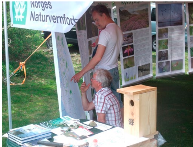
Mye interessant å studere på utstillingen. Her fra visningen på en aktivitetsdag på Storhaug 30.april.

Det er Biofoto Rogaland og Naturvernforbundet som har laget utstillingen med økonomisk støtte fra private og offentlige sponsorer. Sammen med utstillingen følger det utstillingsskiver og spørrekonkurranse. Hver plakater måler