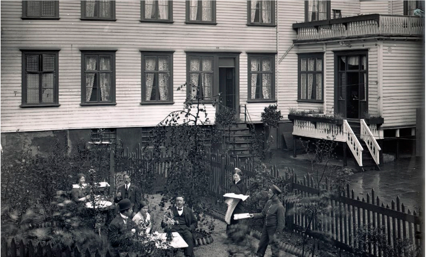
Torskemiddag hørte til foreningens generalforsamlinger i en årrekke. I 1929 ble middagen inntatt på byens mest fasjonale hotell, Grand. Hotellet brant forøvrig til grunnen 9.mai 1945 og ble ikke gjenoppbygd.