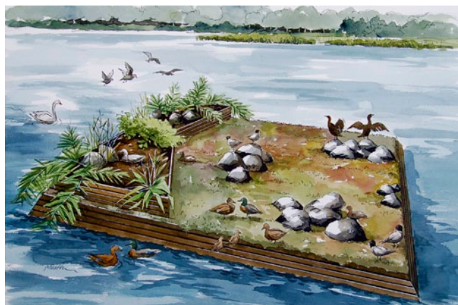
Denne fugleholmen kan flyte i Mosvatnet allerede i løpet av høsten.