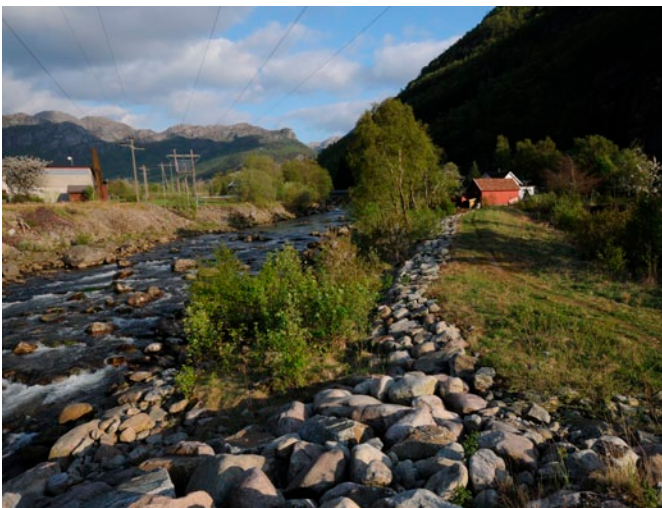
Litleånå, gammelt sideløp ved elva er historie. Løpet er stengt med denne steinfyllingen.

To viktige gytebekker er også sterkt påvirket av byggearbeider. Frøylandsbekken som ligger ved vegstasjonen i dalen, er rasert av entreprenøren. Kampesteiner og en stor betongfylling har effektivt stanset all fiskevandring. Lindelandsbekken ser noe bedre ut etter entreprenørens byggearbeider, men fiskere frykter likevel at den ikke vil fungere godt nok som gytebekk.