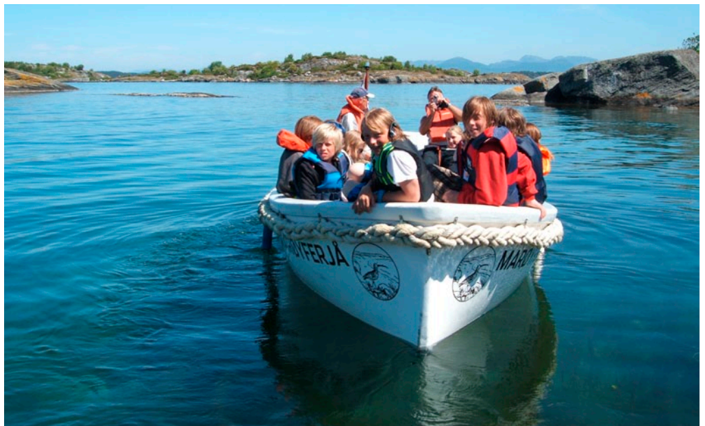
”Marøyferjå” er sommerens badebåt.

Så da gjenstår det bare å pakke badeshortsen, grillpølsene og saftflaske og stille på brygga i Breivik båthavn!