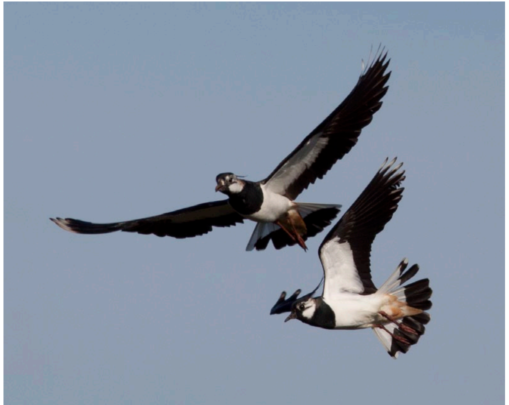
Vipa er et stadig sjeldnere syn på Jærhimmelen. Men noen steder er bestanden sterk.

Disse spørsmålene og mange flere ønsker vi å få svar på gjennom vipeprosjektet som ble startet opp for fullt denne våren og forhåpentligvis vil pågå i mange år fremover. Ved hjelp av brede litteraturstudier, opptelling av vipebestanden, småskala undersøkelser av blant annet hekkesuksess og informasjonssjanser, ønsker Naturvernforbundet i Rogaland å få en bedre forståelse av, og samtidig økt fokus på vipas problemer. Med på laget har vi fått kompetente medhjelpere både fra bondestanden og forvaltningen, og sammen håper vi å finne frem til enkle tiltak som kan lette situasjonen for vipa.