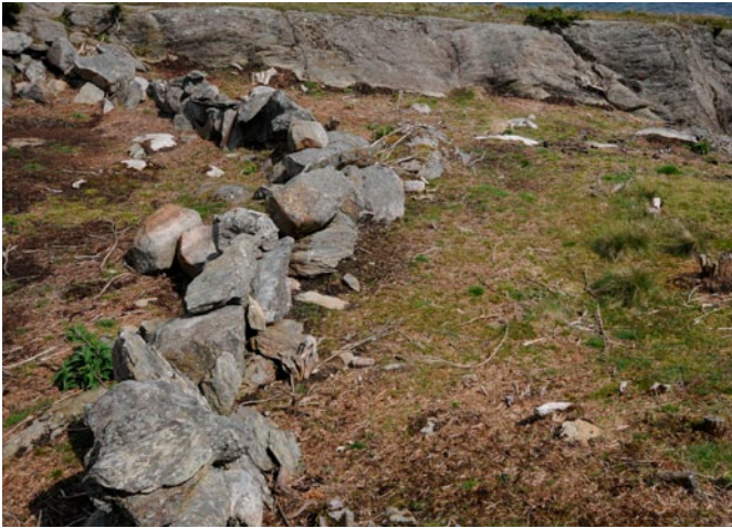
Og slik ser det samme området ut i 2011. Einstapen er bekjempet.

fred til å bygges seg opp, og andre planter viste tegn til å etablere seg i feltet.