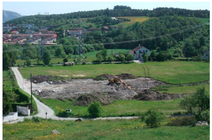
Utfylling og drenering i friområde i Sørmarka er helt OK for Stavanger kommune.

Er det dette som kalles likebehandling, Stavanger kommune?