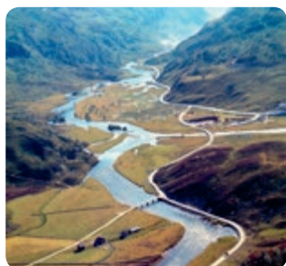
Valdalsdalen før.

Røldalene oppfatter det som et ran og en overkjøring av lokalsamfunnet. Ved ny konsesjonsbehandling mener røldalene at det er mulig å gjenopprette skader og restaurere ødelagt natur. Hvordan og hvorfor får du vite når røldalene kommer til Stavanger og Mostun natursenter.