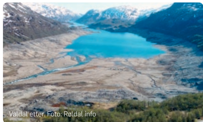
Valdalsdalen etter.