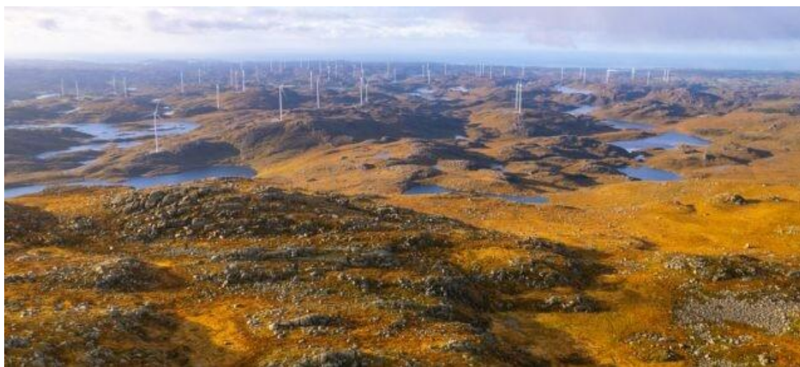
Naturvernforbundet i Rogaland har jobbet med en rekke saker knyttet til vindkraft. Her fra området ved Moifjellet.

Det er ikke alltid naturverninteressene vinner fram. Men i året som gikk har det vært flere positive avklaringer på saker som vi har vært involvert i og planer som vi har protestert mot. Ett av eksemplene på det er at vindkraftplanene i Bergeheia- og Skreå-området ved fylkesgrensen mellom Rogaland og Agder til slutt ble skinlagt av politikerne.