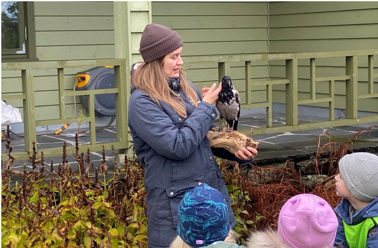
Kråkeundervisning for barnehagebarn.