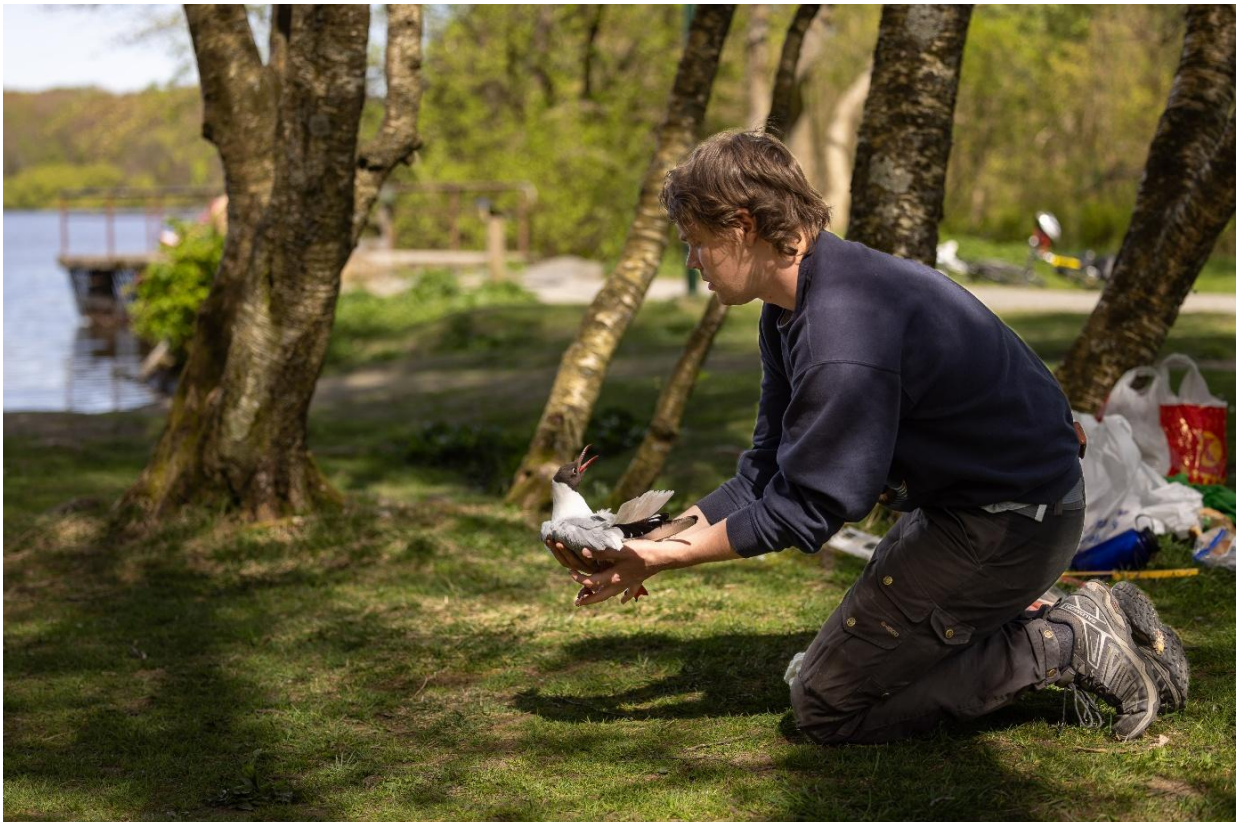
Merking av hettemåker.

For første gang ble direkteendinger fra to kamera, GPS-logging og utvalgte redigerte videosnutter samlet og vist for publikum på nettsiden urbpop.no/mosvatnet . Denne siden ble vist til i all publisering på sosiale medier og ved bruk av QR-koder på plakater satt opp ved turvegen. Det har vært to større magasininnslag på den lokale TV-stasjonen, TV-Vest. Prosjektet ble støttet økonomisk av Miljødirektoratet/Statsforvalteren, Stavanger kommune, Norsk institutt for naturforskning (NINA) og Birdlife Rogaland. Samarbeidspartner NINA ved Sindre Molværsmyr.