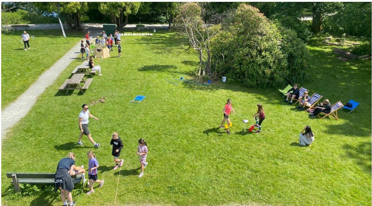
Sommer ved Mosvatnet ble godt besøkt.

Sommer ved Mosvatnet var et åpent, gratis tilbud på Mostun naturcenter som retter seg mot til barnefamilier og som skjer i skoleferien. Tilbudet var del av Barnas sommer, og har fram til i år blitt støttet av Stavanger kommune. Tilbudet var åpent mandag- fredag, samt søndager fra 11.00 - 15.00 gjennom hele skoleferien. Deltagerne fikk oppfølging av en egen aktivitetsvert.