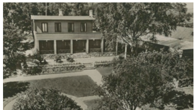
Postkort av Mostun fra 1930-tallet. Mostun er kafe og restaurant med flott hageanlegg og uteservering. Låven til høyre ble trolig revet tidlig på 1960-tallet. Her står nå Inge Steenslands Hus.

Bondeungdomslaget inngår en 15 års kontrakt med kommunen om leie av Mostun. Bolighuset og låven blir renoveret, utvidet og påbygd. BUL starter kafe, restaurant og selskapslokale i Mostun. Samme år blir det bestemt at det skal reises et friluftsmuseum på Mostun-eiendommen i regi av Rogaland Folkemuseum.