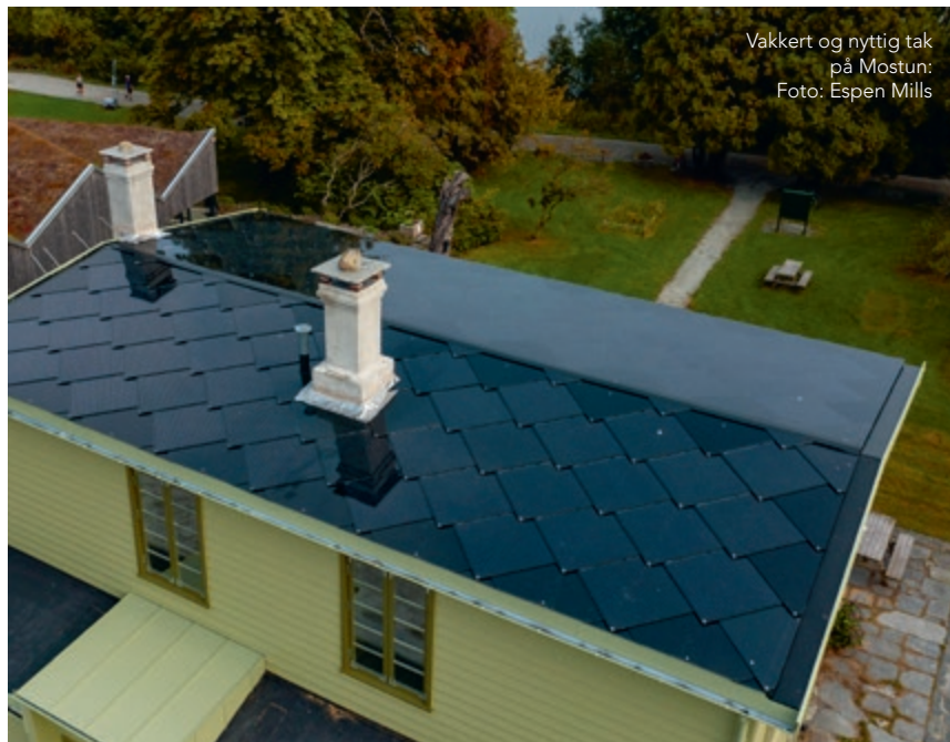
Vakkert og nyttig tak på Mostun: Foto: Espen Mills

Solcelletaksteinen Sunstyle er levert av Ecosol. Grunnen til at valget falt på Sunstyle er i hovedsak for å ivareta det estetiske. Med sine diagonale linjer gir taksteinen et skiferlignende