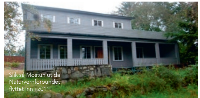
Slik så Mostun ut da Naturvernforbundet flyttet inn i 2011.

I denne perioden skjer det flere nye tiltak i og ved den opprinnelige Mostun-eiendommen. Stavanger Kunstmuseum som ligger sør for Mostun blir åpnet i 1990 og nord for Mostun blir byens første rensesepark i Madlabekken åpnet i 1991. I 2009-2010 blir Tjensvollkrysset ombygd og en del av arealet vest for Mostun går med i byggingen av den såkalte «glorien».