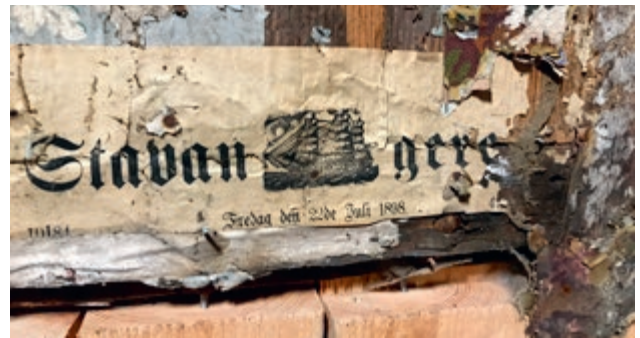
Dette avisklippet fra avisa Stavangeren ble funnet limt på veggen i 1. etasje og er datert fredag 22.juli 1898, samme år som Mostun ble bygd på med en etasje.