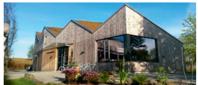
Inge Steenslands Hus er natursenterets storstue og ble innflyttet høsten 2016.